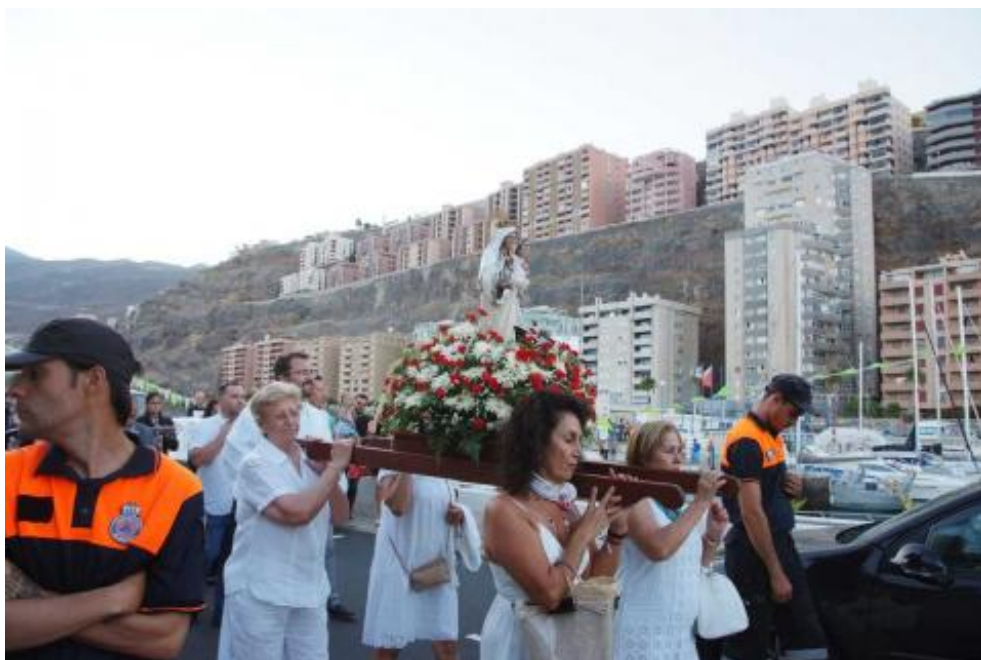
La Virgen del Carmen procesiona por el litoral de El Rosario