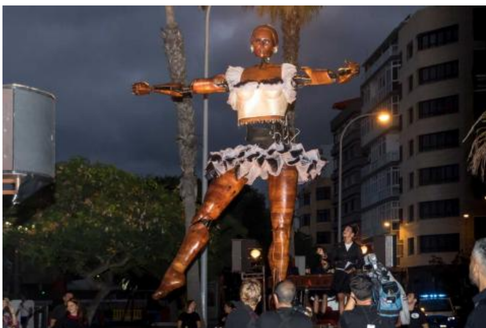
La Bailarina, como exponente del teatro de máquinas